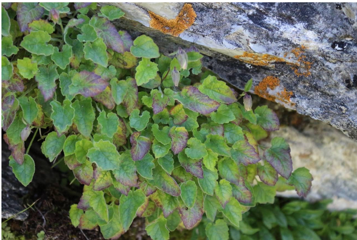
Рис. 1. Campanula autraniana Albov (хребет Аибга, пик Чёрный, в истоках р. Псоу). Fig 1. Campanula autraniana Albov (Aibga ridge, peak Cherniy, source of the Psou river).

Campanula autraniana Albov – колокольчик Отрана (рис. 1). Эндемик Северной Колхиды. Вид включен в Красные книги России [14] и Краснодарского края [13]. Адлерский район Сочи, хребет Аибга, пик Чёрный, склон юго-восточной экспозиции в истоках р. Псоу, на отвесных известняковых скалах, 11.07.2014, И.Н. Тимухин, Б.С. Туниев (SNP).