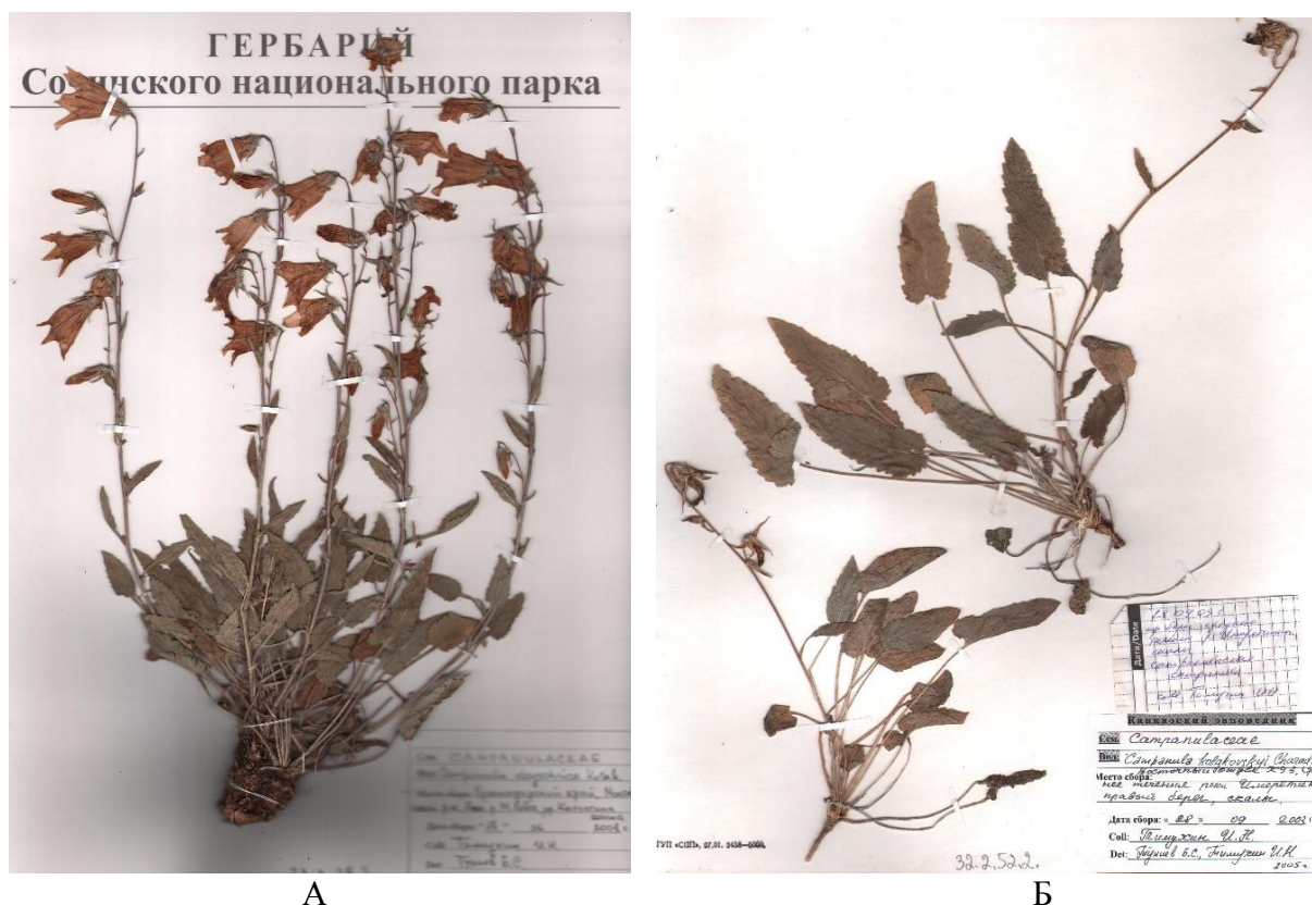
Рис. 2. А – Campanula dzyschrica Kolak. (бассейн р. Малая Лаба, балка Капустина); Б – Campanula kolakovskiy Charadze (Карачаево-Черкесская Республика, р. Имеретинка). Fig. 2. А – Campanula dzyschrica Kolak. (basin of the Malaya Laba river, Kapustina balk); В – Campanula kolakovskiy Charadze (Karachay-Cherkessia Republic, the Imeretinka river).

Вид был описан с горы Малая Дзышра Бзыбского хребта, позже найден также в пограничных районах Краснодарского края на хр. Дзыхра [11], в ущ. Ахцу и в истоках р. Псоу [17]. Нахождение вида на северном макросклоне Западного Кавказа весьма интересно и дополняет такие находки северокавказских видов (в том же локалитете), как Gentiana paradoxa Albov, Cotoneaster soczavianus Pojark., а также распространенных преимущественно в Колхиде Iris colchica Kem.-Nath., Steveniella satyrioides (Stev.) Schlechter и др., что является еще одним подтверждением сохранения Бело-Лабинского рефугиума колхидской биоты [19, 20].