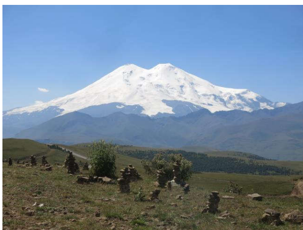
Рис. 1. Национальный парк «Приэльбрусье», гора Эльбрус.

брусня того периода, которые сохранились, к сожалению, и сегодня. Это в первую очередь: неорганизованное и непрерывное хаотичное рекреационное строительство; необоснованное отчуждение земель различными организациями; увеличение числа неорганизованных туристов – экскурсантов и отсутствие механизмов их регулирования; нарушение природных комплексов и сокращение ландшафтов, конкретных экосистем, в частности, сосновых лесов, высокогорных лугов. Следует отметить, что ни один пункт из этих проблем до сегодняшнего дня не решен.